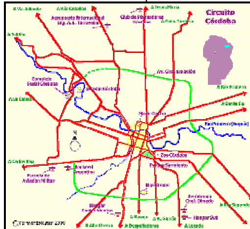
Figura N° 1: Plano de ubicación de la ciudad de Córdoba

La ciudad fue creciendo hacia ambas márgenes de dicho río, separando la zona de mayor densidad de población (microcentro), de áreas con uso de suelo exclusivamente residencial con viviendas de tipo unifamiliar.