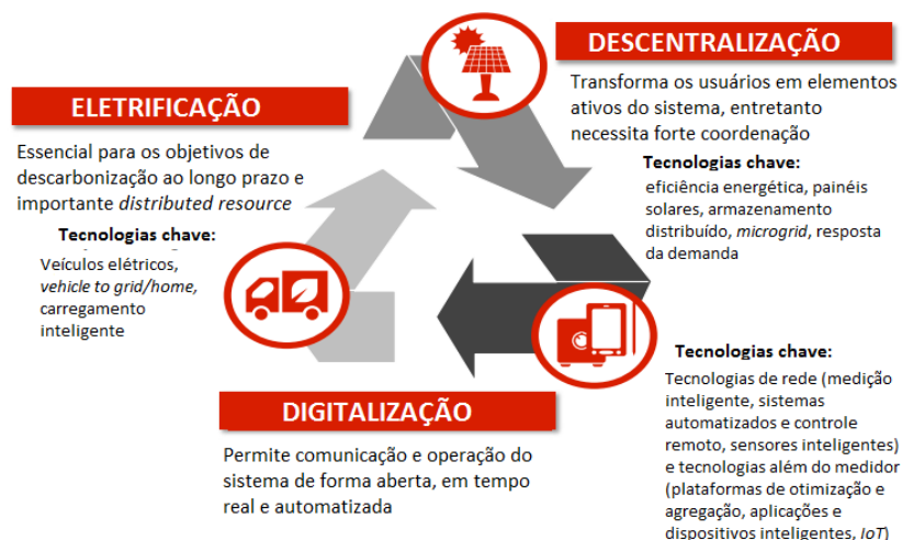
Figura 3: Três tendências da transformação do grid edge

De acordo com Dijk et al. (2013) e Martin et al. (2018), o desenvolvimento das tecnologias de energia renovável e o surgimento de tecnologias smart-grid e grid edge afetarão diretamente a eletrificação dos transportes. O desenvolvimento das energias renováveis intermitentes (solar e eólica) introduzem uma quantidade cada vez maior de fontes de geração de energia não despachável (fontes de energia que podem ser ativadas e desativadas ou ajustadas conforme a demanda) no sistema. A natureza intermitente destas energias exige maior flexibilidade da rede elétrica para manter a frequência constante, o que demanda (aumento da) capacidade de armazenamento dos veículos e da gestão digital da demanda, fornecimento e armazenamento.