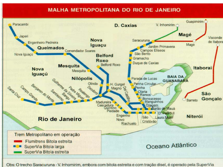
Figura 2. Área de influência do ramal.

foi ligada a no máximo 4 estações, sendo estas as de maiores fluxos. A figura 2 mostra um mapa onde se pode identificar a área de influência do ramal, a tabela 2 o número de viagens nas estações no ano de 2001, o quadro 1 as centralidades na área de influência e o quadro 2 as centralidades nas estações do ramal, obtidas usando o software UCINET. O quadro 3 mostra as centralidades de intermediação de fluxo. Nos quadros, os maiores valores estão indicados em negrito.