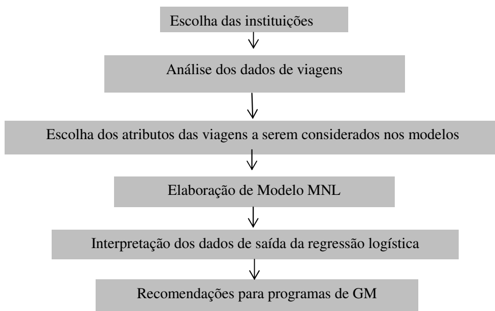
Figura 1: Procedimento Metodológico Proposto